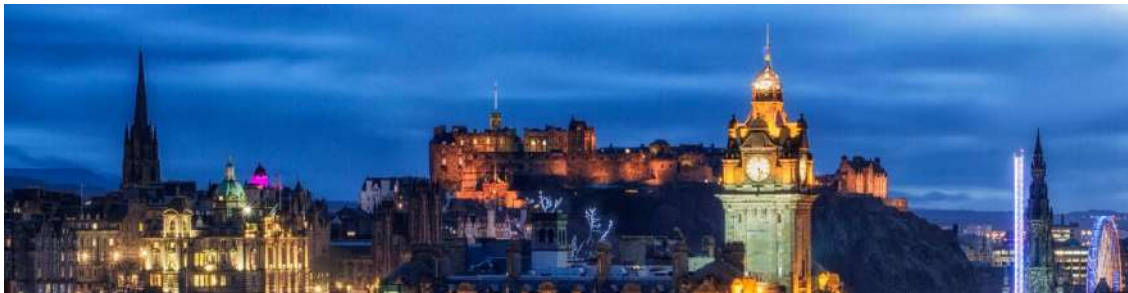
19th International Conference on Leisure and Tourism Marketing: Edinburgh (UK), 15-16 de junio de 2017

eass European Association for Sociology of Sport