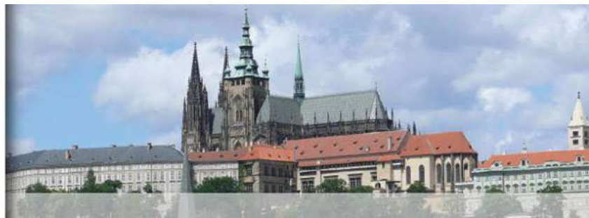
14th EASS conference: Praga, 14-17 de junio de 2017