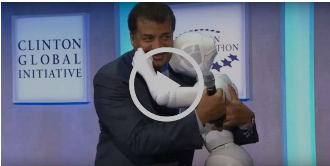
Ya están aquí. ROBOTS Y OCIO

Aunque se trata de un ámbito de estudio incipiente, los robots sociales y las posibilidades que entrañan en el ámbito del ocio y la recreación son ya objeto de estudio en las Ciencias Sociales. Su contribución al bienestar de las personas mayores es, por ejemplo, una de las líneas de interés más recurrente (Universidad Ben-Gurion del Negev, Israel). ¿Qué otros colectivos puede beneficiarse de ellos? ¿Qué papel pueden desempeñar desde el punto de vista del ocio y la recreación? ¿Pueden contribuir al enriquecimiento de la vida personal y social? ¿Cómo? Ver video