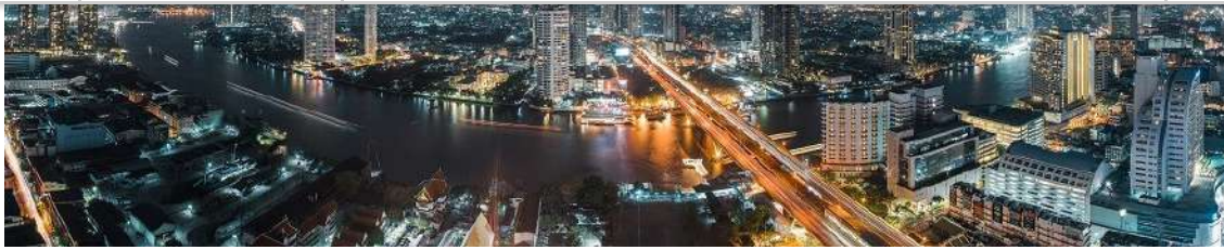
19th International Conference on Sport, Exercise, Leadership in Recreation and Leisure Services: Bangkok (Thailandia), 7-8 de febrero de 2017