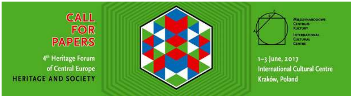
4th Heritage Forum of Central Europe: Kraków, 1-3 de junio de 2017